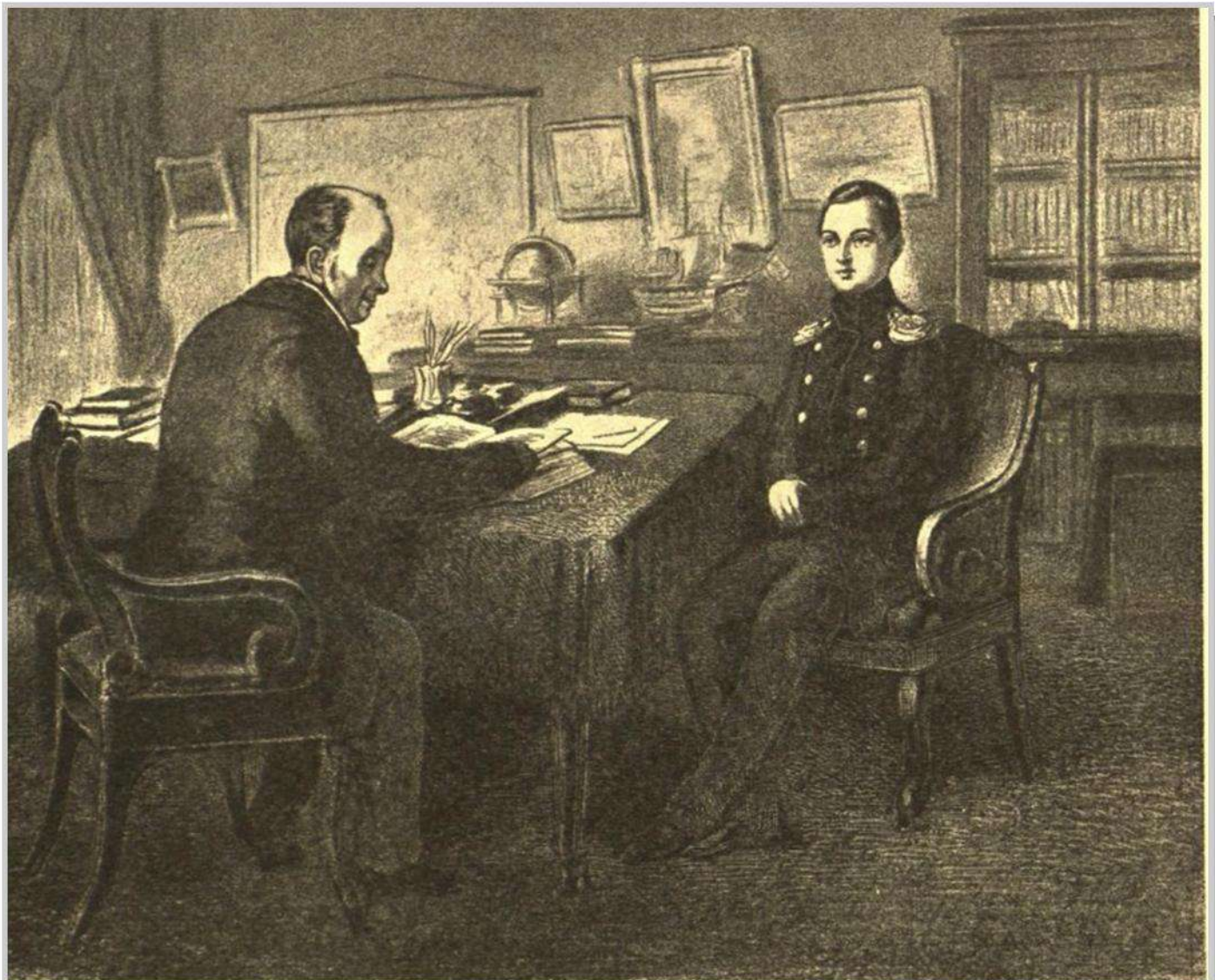
Царевич Александр Михайлович за уроком В.А.Жуковского

Василий Жуковский всегда открыто выступал за отмену крепостного права и идеи свои доносил до будущего императора. Возможно, влияние наставника сыграло не последнюю роль во внутренней политике Александра II.