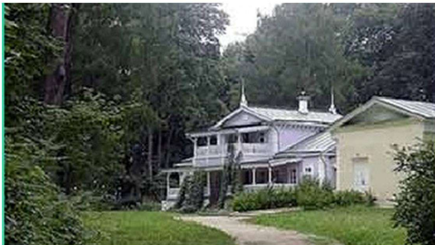
Имение И.С.Тургенева в Спасском

Вскоре после отмены крепостного права, в 1862 г., своим распоряжением подарил барский дом в Грибовке для школы. А в 1863 г. учредил и открыл школу в имении в Спасском. Иван Сергеевич отпускал средства на ее содержание (жалованье учителям и покупку учебников и учебных пособий), следил за тем, чтобы в ней преподавали хорошие педагоги, и за тем, какие успехи показывают ее ученики.