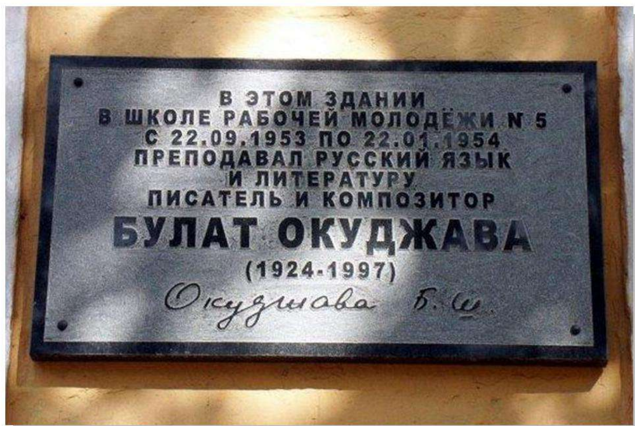
Памятная доска на здании школы

Свои впечатления об этих событиях он описал в рассказе "Искусство кройки и житья". Через год он переводится в Калугу, в школу №5, которая когда-то была одной из первых в России женских гимназий, основанную в 1860 году. Школа отличалась сильным преподавательским составом. В средней школе №5 он проработал около двух лет.