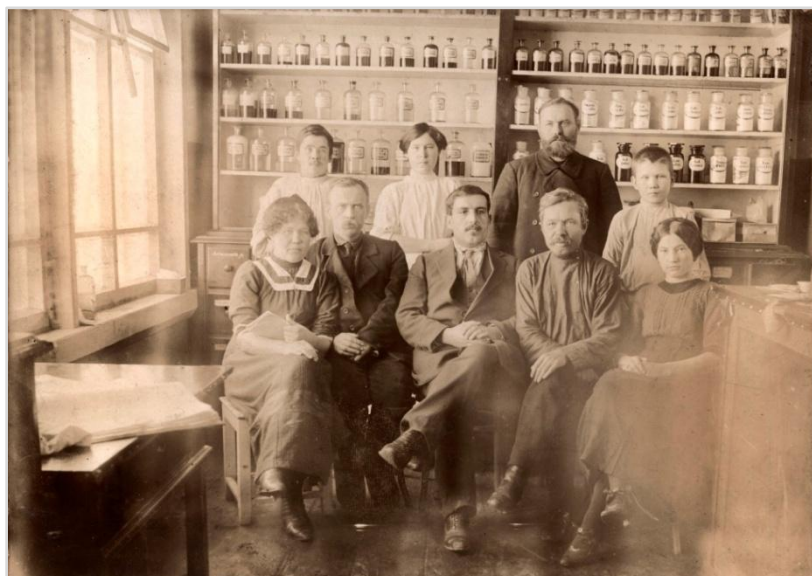
Аптека Юсьвинской земской больницы, 1914 г. (Коми-Пермяцкий краеведческий музей им. П.И.Субботина–Пермяка)